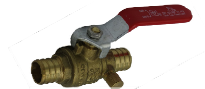
PEX – Valve droite et drain – Passage intégral