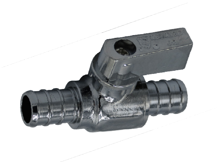
PEX Valve droite – chromé – sans plomb