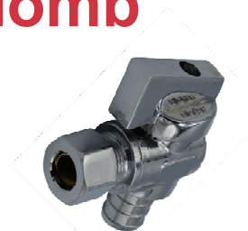
PEX X Compr. – Chromé – Valve à angle

Référence de la liste de prix : 701 – Valves en PEX/PE-RT – sans plomb