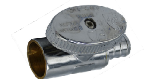
PEX X Femelle – Soudé en cuivre – Chromé – Valve droite