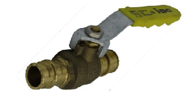
F-1960 – Valve droite – Passage intégral – Laiton