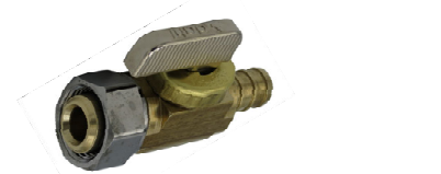
1/2 raccord union de collecteur X PEX mini valve d'arrêt à bille